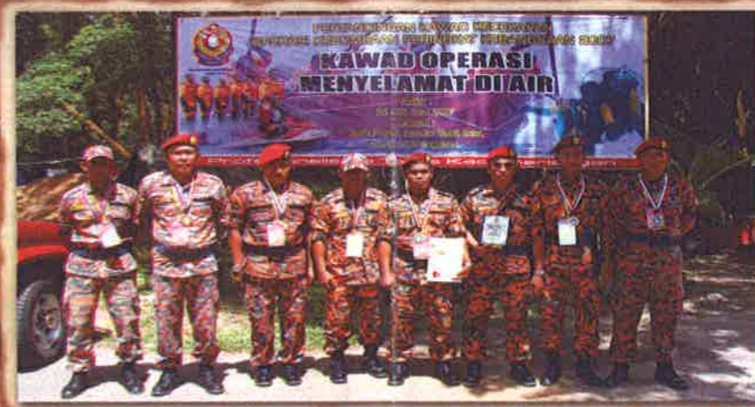
JUARA MENYELAMAT DI AIR SARAWAK