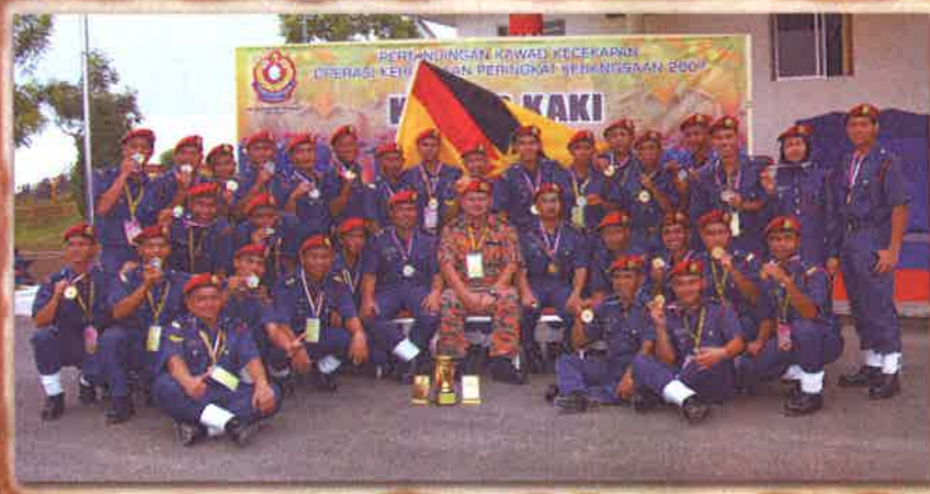
JUARA KAWAD KAKI SARAWAK