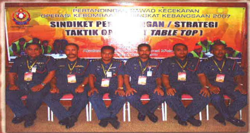
JUARA TABLE-TOP SELANGOR