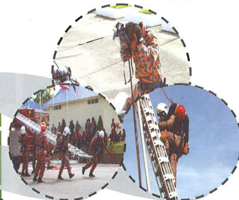
Keputusan Rasmi Acara Kawad Operasi Menyelamat Menurunkan Mangsa 2007