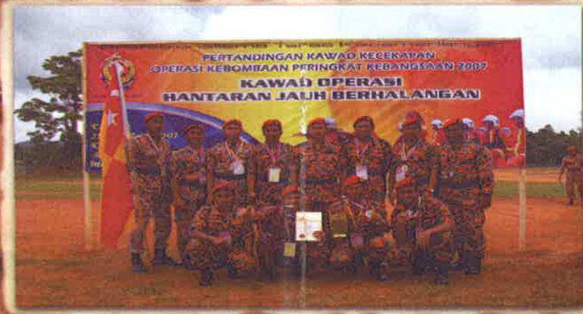
JUARA HANTARAN JAUH BERHALANGAN SELANGOR