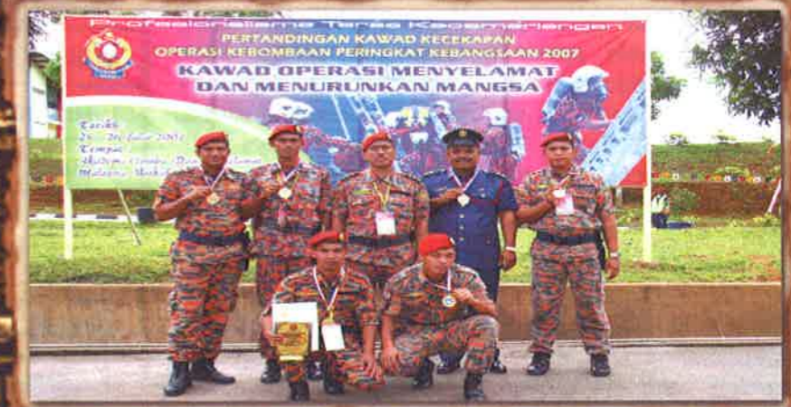
JUARA MENYELAMAT MENURUNKAN MANGSA PAHANG