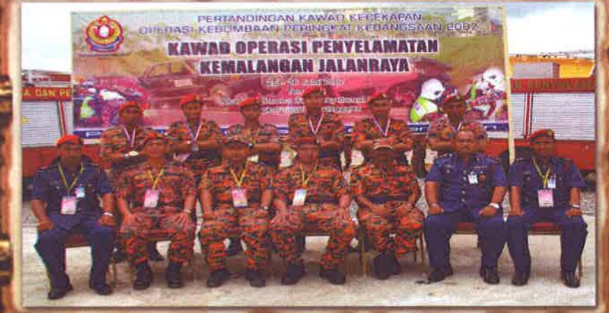
JUARA RTA WP LABUAN