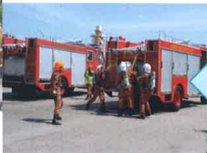
KAWAD OPERASI MENYELAMAT MENURUNKAN MANGSA