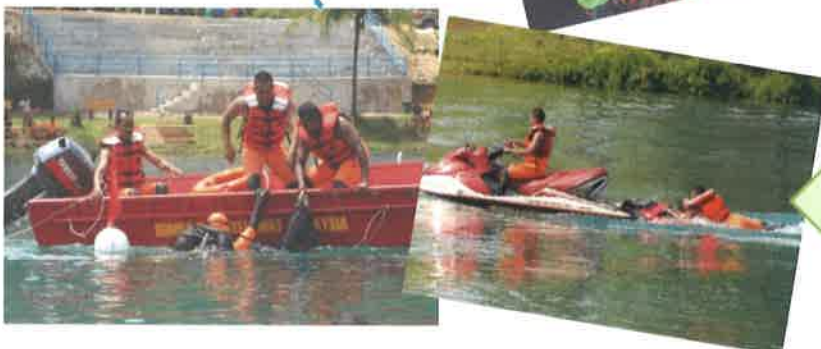
KAWAD OPERASI MENYELAMAT DI AIR