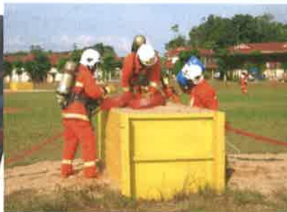
KAWAD HANTARAN JAUH