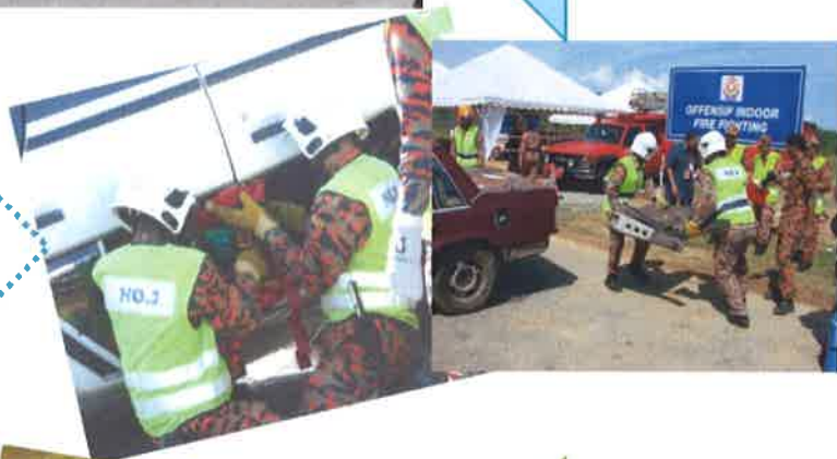
KAWAD OPERASI PENYELAMATAN JALANRAYA