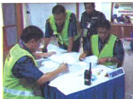
Keputusan.....peserta membuat perbincangan sebelum membuat keputusan terakhir