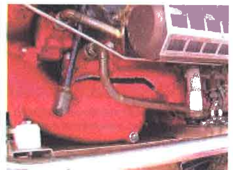
Pecah.....pump casing 'Portable Pump' dan 'male coupling' pecah semasa pertandingan kali ini