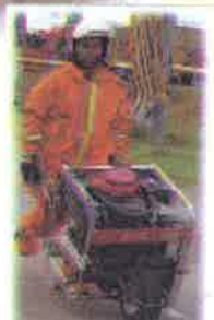
Harap-harap tak pecah pump casing aku ni...