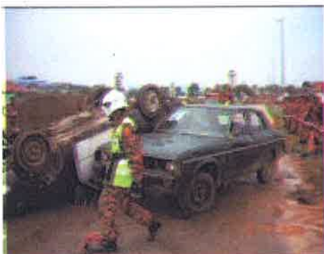
Tinjau....anggota membuat tinjauan sebelum memulakan kerja-kerja penyelamatan