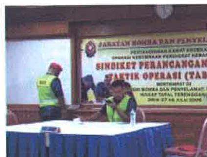
Bantuan.....peserta meminta bantuan dari agensi-agensinya yang berkaitan dalam menangani bencana