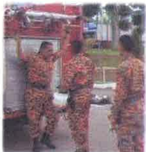
Opps..jange ambik tangga ni, aku tak rela