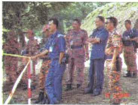
Sokongan...ketua kontingen hadir disetiap lokasi pertandingan untuk memberikan sokongan padu