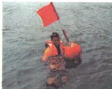
Mangsa...peserta dikehendaki mengambil mangsa ini dengan menggunakan jetski dan membawa ke Phonton Perhentian