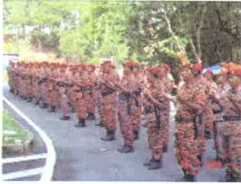
Keselamatan....peserta mengaminkan Doa bagi memastikan keselamatan semasa pertandingan terpelihara

26 Julai 2006 - Tepat jam 0900 pagi, bertempat di Tasik Puteri Bukit Besi, Dungun, acara Kawat Operasi Menyelamat Di Air telah dimulakan. Dengan diketuai oleh ketua pengadil yang berpengalaman dalam acara ini, sebanyak lapan (8) pasukan telah berjaya menunjukkan kemahiran dan ketangkasan dalam merebut kejuaraan acara ini. Pelbagai ragam sebelum dan selepas pertandingan dapat disaksikan