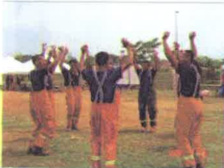
Kekuatan....setiap pasukan memanasakan badan sebelum pertandingan