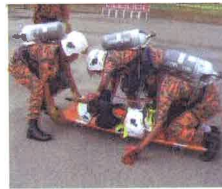
Pengusungan...mangsa diletakkan di atas 'stretcher'