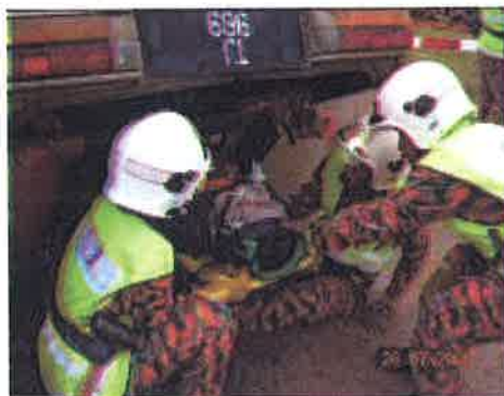
Penyelamatan....kerja-kerja mengeluarkan mangsa dilakukan setelah selesai kerja pemotongan