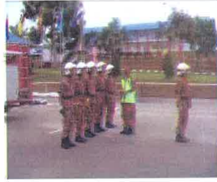
Periksa...pengadil membuat pemeriksaan terhadap peralatan yang akan digunakan dan kekemasan pakaian