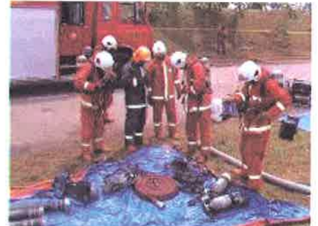
Siap.....peserta membuat pemeriksaan terakhir terhadap kelengkapan diri

26 Julai 2006 - Tepat jam 0900 pagi, bertempat di Jalan Susur Kuarters FRAM Wakaf Tapai, acara Kawat Operasi Hantaran Jauh Berhalangan telah dimulakan. Dengan diketuai oleh ketua pengadil yang berpengalaman dalam acara ini, sebanyak sebelas (11) pasukan telah berjaya menunjukkan kemahiran dan ketangkasan dalam merebut kejuaraan acara ini. Pelbagai ragam sebelum dan selepas pertandingan dapat disaksikan, dimana antaranya ada pasukan yang telah berjaya memecahkan 'pump casing' dan meletupkan 'male coupling'. Atas budi bicara dan persetujuan ketua pengadil, sebanyak 3 pasukan telah diulang semula pertandingan kerana 'technical default'. Manakala 2 pasukan telah tersingkir dari pertandingan. Keseluruhannya pada hari pertama Pertandingan Kawat Operasi Hantaran Jauh Berhalangan telah berjaya dilaksanakan.