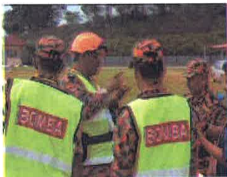
Taklimat.....ketua pengadil memberi taklimat ringkas kepada pengadil pertandingan