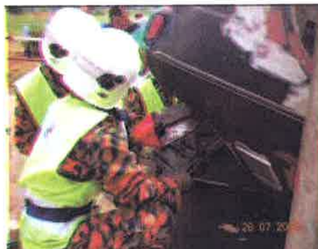
Potong....peserta mula membuat kerja-kerja pemotongan kenderaan