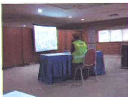
Penilaian....pegawai operasi menilai keadaan kawasan bencana

26 Julai 2006 - Tepat jam 0900 pagi, bertempat di Bilik Gerakan FRAM Wakaf Tapai, acara Sindiket Perancangan / Strategi Taktik Operasi telah dimulakan. Dengan diketuai oleh ketua pengadil yang berpengalaman dalam acara ini, sebanyak sembilan (9) pasukan telah berjaya menunjukkan kemahiran dan kebijaksanaan masing-masing dalam merebut kejuaraan acara ini..