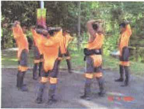
Regangan....peserta melakukan regangan terlebih dahulu bagi memastikan tidak berlaku kekejangan otot