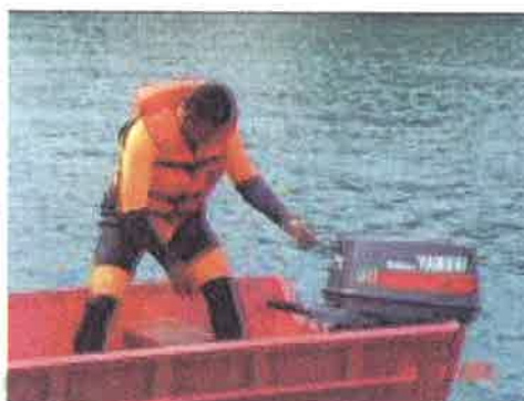
Masalah....peserta haruslah mahir dalam mengendalikan injin bot