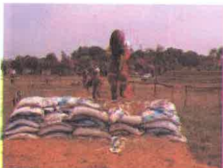
Halangan....antara halangan-halangan yang perlu ditempuhi