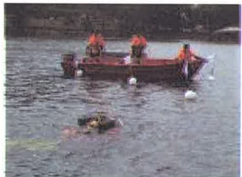
Berenang....penyelamat berenang membawa mangsa ke arah bot