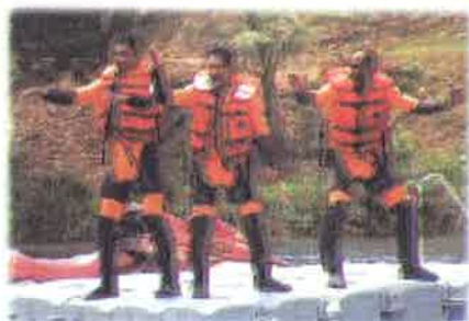
Kawan-kawan.....jom kita taichi dulu