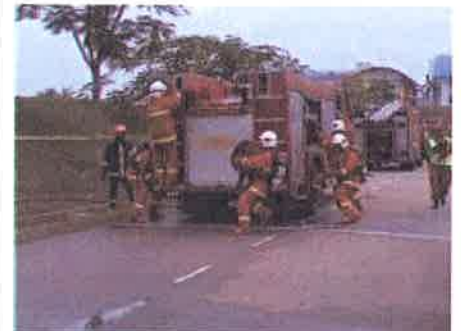
Mula.....masa mula dikira setelah wisel permulaan dibunyikan