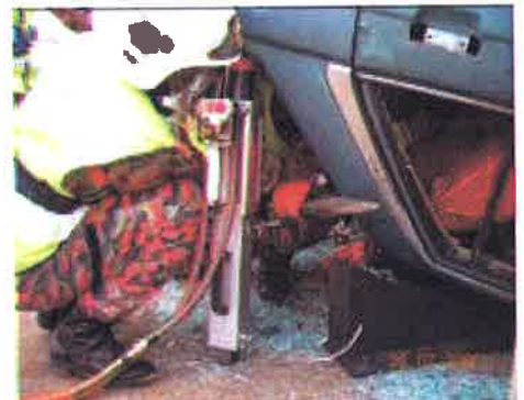
Stabil....peralatan yang betul harus digunakan dalam penstabilan kenderaan