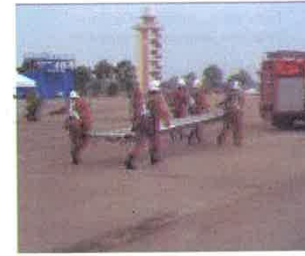
Kemas...peserta membawa tangga ke jentera bagi menamatkan pertandingan