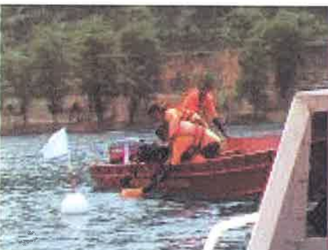
Angkat....peserta yang berada di atas bot membantu mengangkat mangsa