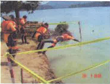
Mula....peserta mula terjun di dalam air dan berenang sejauh 50m ke tempat bot