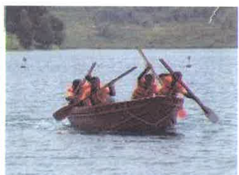
Kayuh...peserta harus mengayuh bot ini sebelum menamatkan pertandingan