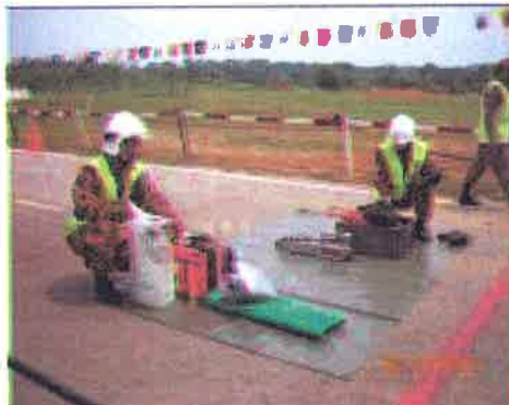
Siap Sedia....peserta memastikan peralatan yang digunakan siap sedia untuk diberi kepada penyelamat