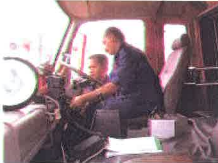
Pengujian....pihak bengkel sentiasa memastikan kenderaan dalam keadaan baik