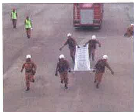
Mula....peserta mula membawa tangga ke menara kawat bagi menyelamatkan mangsa