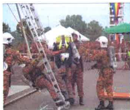
Turun...penyelamat menurunkan mangsa