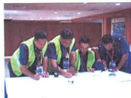
Bincang....peserta membuat perbincangan untuk persiapan terakhir sebelum menyerahkan kertas pertandingan kepada ketua pengadil

26 Julai 2006 - Tepat jam 0900 pagi, bertempat di Bilik Gerakan FRAM Wakaf Tapai, acara Sindiket Perancangan / Strategi Taktik Operasi telah dimulakan. Dengan diketuai oleh ketua pengadil yang berpengalaman dalam acara ini, sebanyak sembilan (9) pasukan telah berjaya menunjukkan kemahiran dan kebijaksanaan masing-masing dalam merebut kejuaraan acara ini..