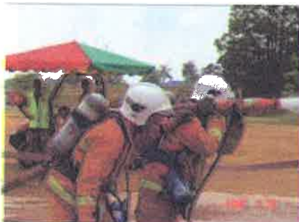
Padam....setiap pasukan dikehendaki memastikan api dipadam sepenuhnya sebelum masa dihentikan