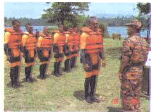
Lapor....ketua pasukan melaporkan diri kepada pengadil sebelum memulakan pertandingan