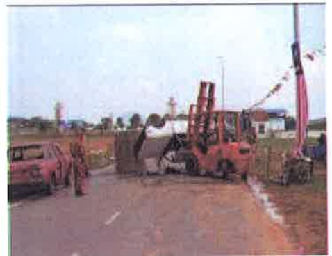
Susun....petugas mula menyusun kedudukan kenderaan mengikut ketetapan yang telah ditetapkan