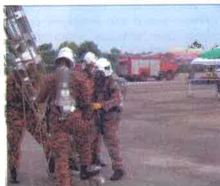
Keselamatan....peserta mestilah mengikut prosedur (SOP) supaya risiko dapat dikurangkan.