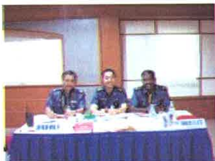
Pengadil....barisan pengadil yang ditugaskan mengadili pertandingan ini