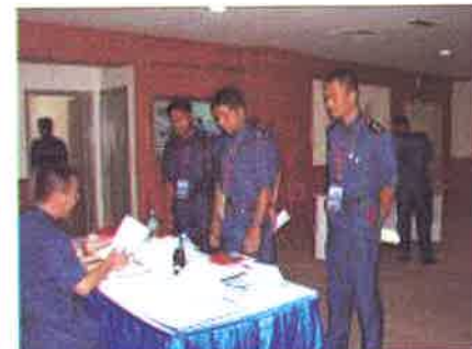
Lapor...Ketua Pasukan melapor diri kepada ketua pengadil sebelum memulakan pertandingan