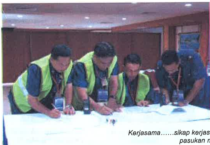
Kerjasama.....sikap kerjasama yang ditunjukkan oleh setiap pasukan membanggakan