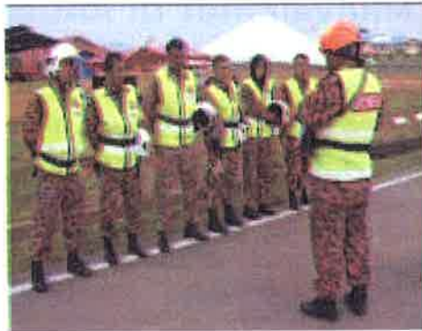
Penerangan.....ketua pengadil menerangkan tatacara kawat penyelamatan kemalangan jalanraya

26 Julai 2006 - Tepat jam 0900 pagi, bertempat di Jalan Susur Utama Padang Kawat, FRAM Wakaf Tapai, acara Kawat Operasi Penyelamatan Kemalangan Jalanraya telah dimulakan. Dengan diketuai oleh ketua pengadil yang berpengalaman dalam acara ini, sebanyak sebelas (11) pasukan telah berjaya menunjukkan kemahiran dan ketangkasan dalam merebut kejuaraan acara ini. Pelbagai ragam sebelum dan selepas pertandingan dapat disaksikan, dimana antaranya ada pasukan yang tidak berjaya mengeluarkan mangsa.