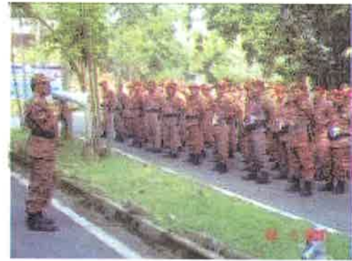
Penerangan.....ketua pengadil menerangkan tatacara kawat menyelamat menyelamat di air

26 Julai 2006 - Tepat jam 0900 pagi, bertempat di Tasik Puteri Bukit Besi, Dungun, acara Kawat Operasi Menyelamat Di Air telah dimulakan. Dengan diketuai oleh ketua pengadil yang berpengalaman dalam acara ini, sebanyak lapan (8) pasukan telah berjaya menunjukkan kemahiran dan ketangkasan dalam merebut kejuaraan acara ini. Pelbagai ragam sebelum dan selepas pertandingan dapat disaksikan