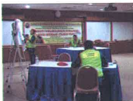
Tugasan....peserta sibuk menjalankan tugas masing-masing