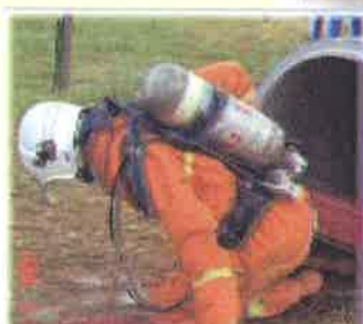
Alamak...tersepit pulak kaki aku