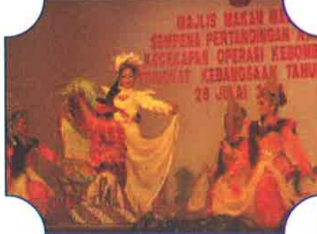
Menarik....persembahan kebudayaan dari Kumpulan Kebudayaan Negeri Terengganu telah memeriahkan lagi majlis ini.