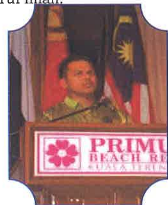
Aluan....ucapan YS Komandan selaku Pengerusi Pengelola Pertandingan